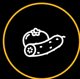
PRODUCTOS FRESCOS VEGETALES Y HORTOFRUTÍCOLAS